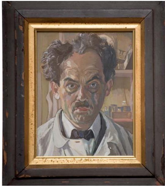
Selbstbildnis, Reinhold Nägele 1930