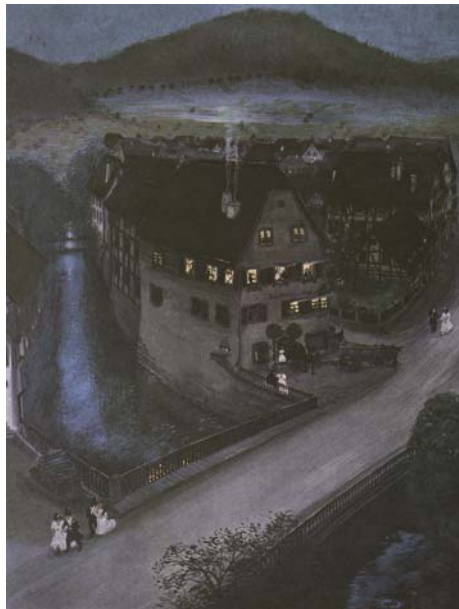
Schwäbische Hochzeit, Reinhold Nägele 1909